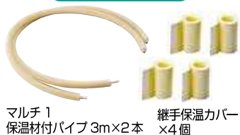
マルチ1 保温材付パイプ 3m×2本 継手保温カバー ×4個