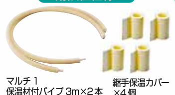
マルチ1 保温材付パイプ 3m×2本 継手保温カバー ×4個