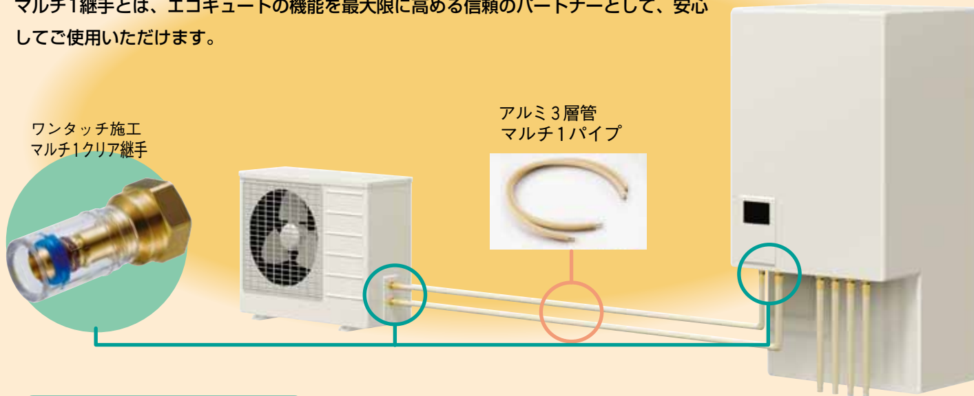
ワンタッチ施工 マルチ1クリア継手

マルチ1継手とは、エコキュートの機能を最大限に高める信頼のパートナーとして、安心してご使用いただけます。