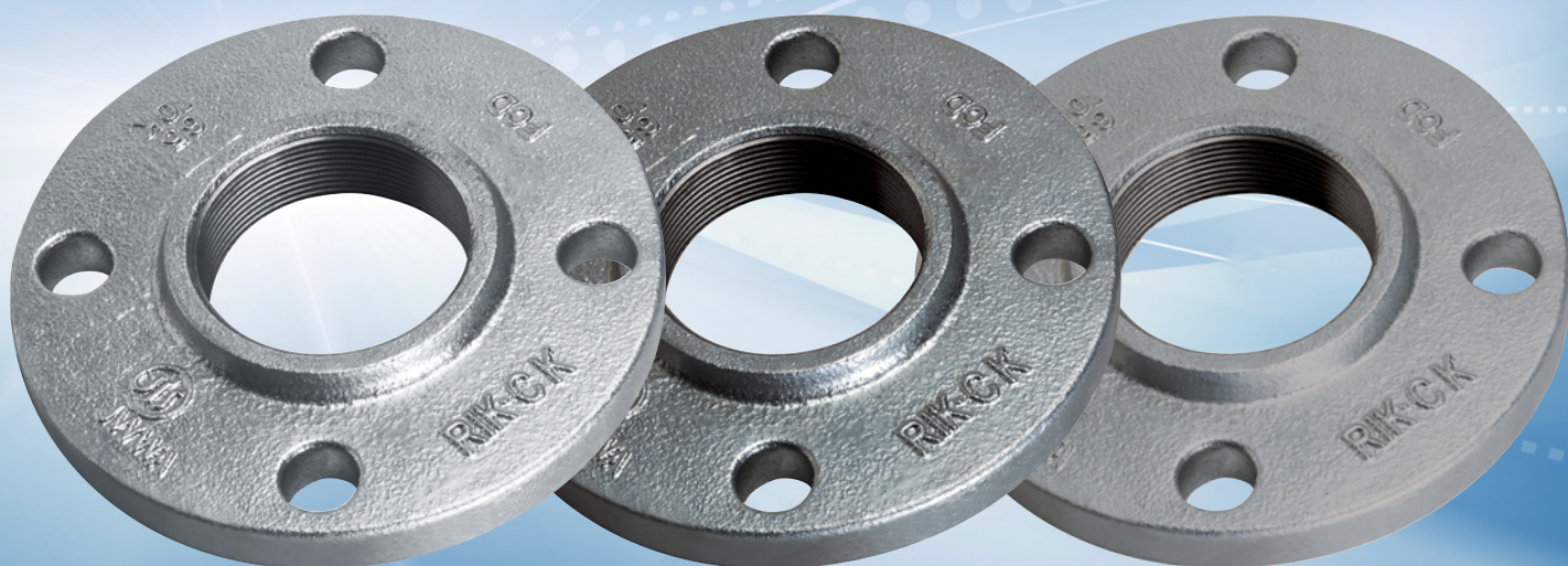
白品 (JIS B 2239適合品)