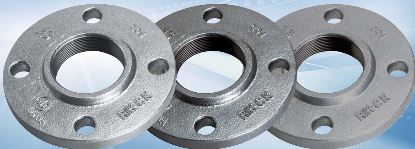
白品 (JIS B 2239適合品)